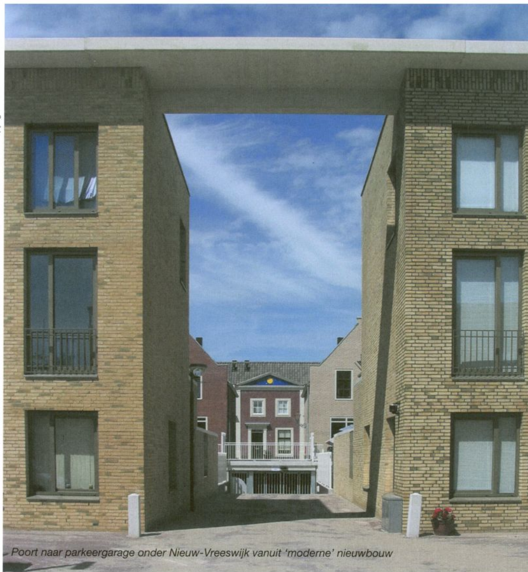
Poort naar parkeergarage onder Nieuw-Vreeswijk vanuit 'moderne' nieuwbouw

Instituut Woningbouw. De voorwaarden waaronder zijn echter opgesteld door een club die verbonden is aan kozijn- en deurfabrikanten. Consumenten zouden hun garanties zelf moeten formuleren en zich moeten realiseren welke premies daarvoor in de koopsom betaald moet worden.