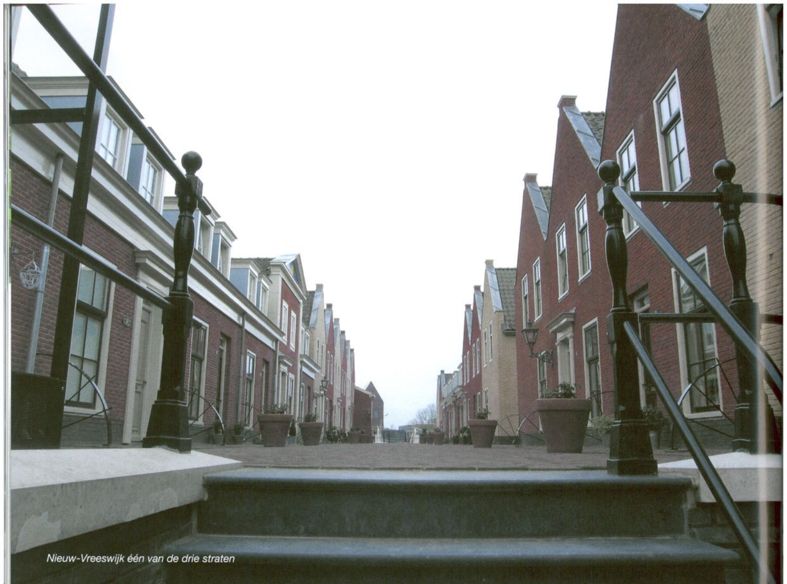
Nieuw-Vreeswijk één van de drie straten