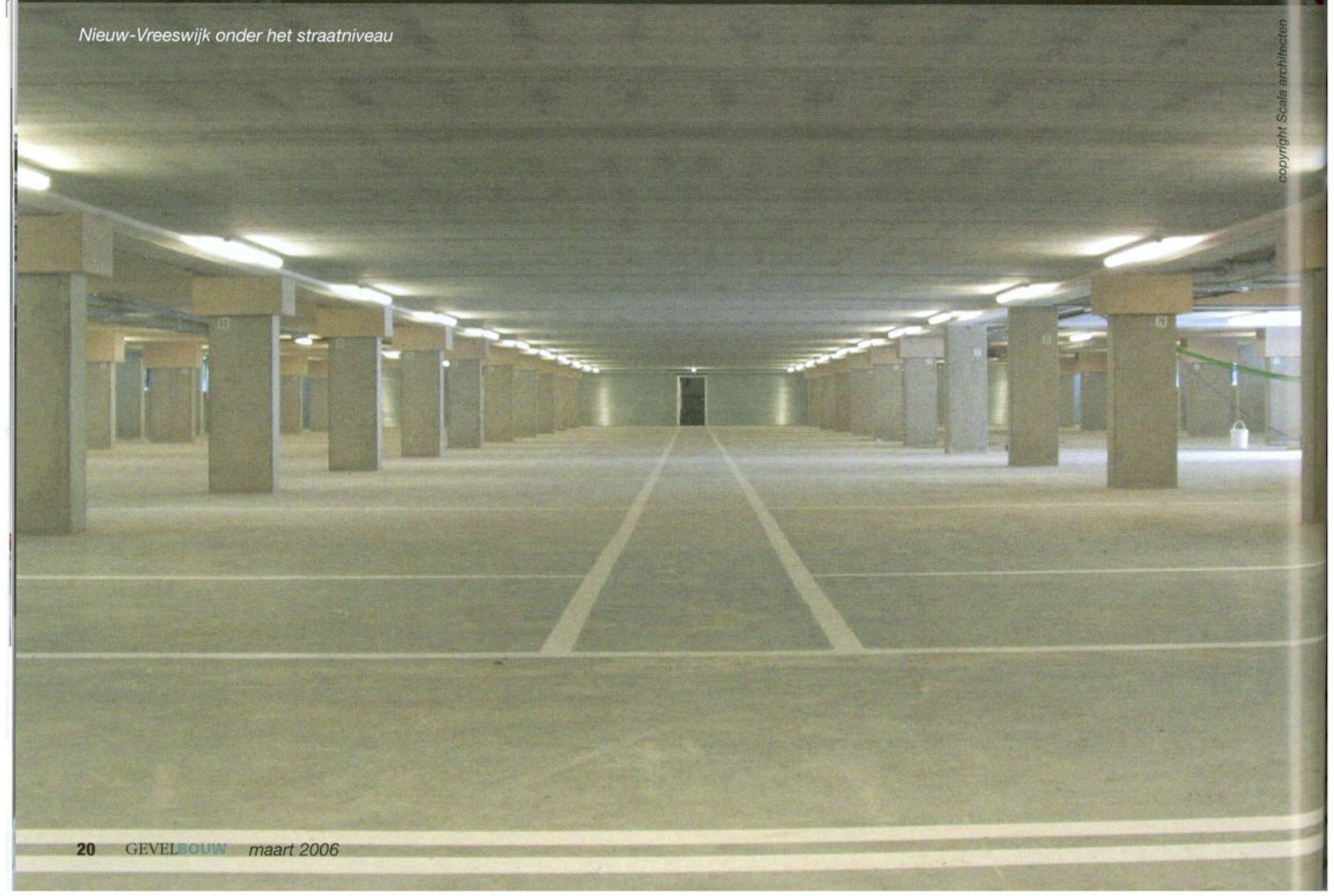
Nieuw-Vreeswijk onder het straatniveau